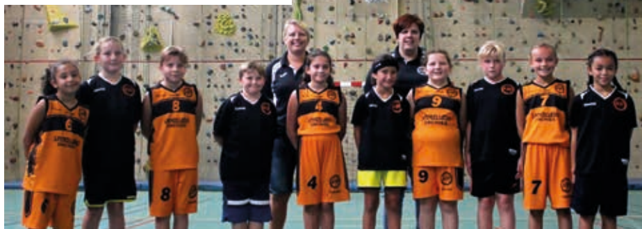
Une nouvelle équipe a été créée cette année. Il s'agit des poussines (U11) composée uniquement de filles.