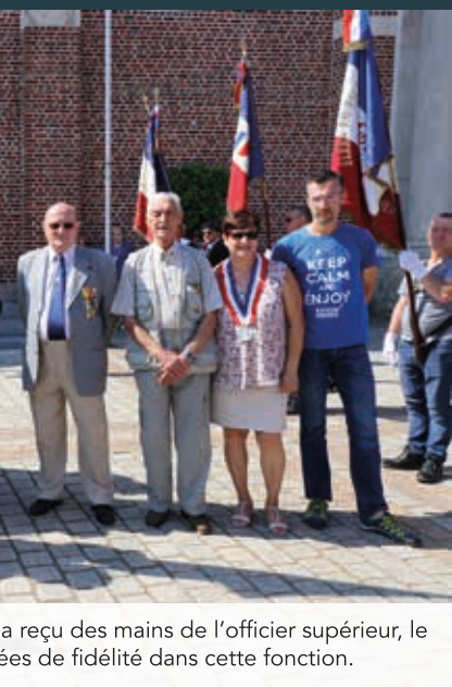
a reçu des mains de l'officier supérieur, le ées de fidélité dans cette fonction.