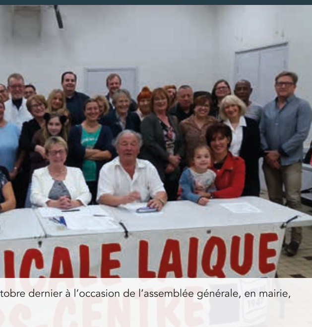
tobre dernier à l'occasion de l'assemblée générale, en mairie,