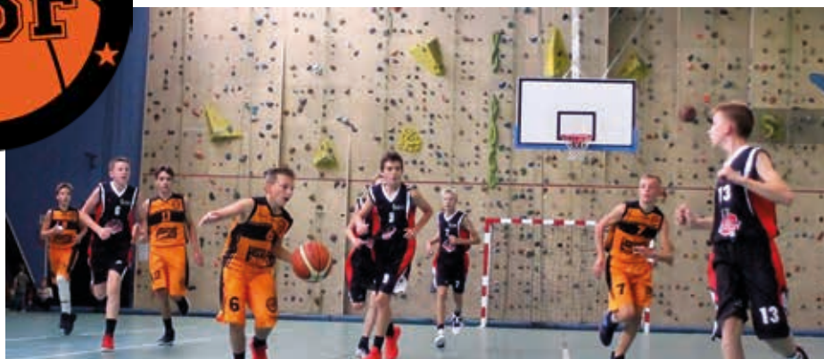
Une action de match lors d'un match de l'équipe minimines (U13), une autre équipe sur laquelle le club flersois pose beaucoup d'espoirs.

Le club passera le cap des 10 ans dans une salle des sports rénovée, salle pour laquelle l'investissement consenti par la municipalité montre au combien les élus sont sans cesse derrière les clubs sportifs locaux. De son côté, l'ABF réfléchit déjà à la manière de célébrer cet anniversaire en juin prochain. Un week-end qui sera évidemment placé sous le signe du sport et de la fête. Les basketteurs Flersois comptent sur la présence des anciens du club qui devraient leur permettre de négocier ce virage avec confiance et sérénité.