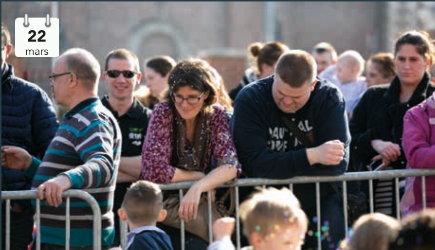
Les enfants de l'école maternelle ont défilé devant les parents, venus nombreux. Et devinez qui a reçu des tonnes de confettis?