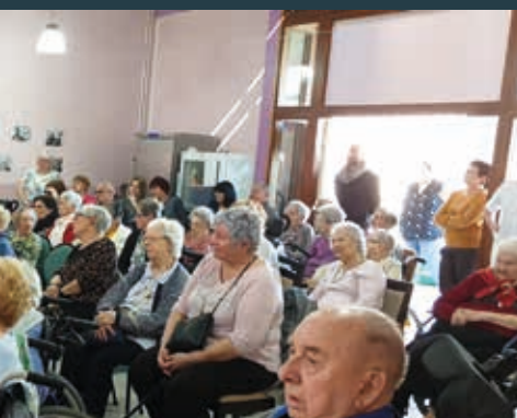
agement» a animé pendant une théâtre) à l'EHPAD «Le Parc Fleuri»