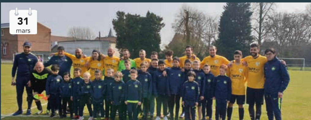
L'équipe première de l'US Pont Flers s'est imposée face à Lecluse sur le score fleuve de 10-1. De quoi impressionner les jeunes footballeurs du club qui ont eu l'honneur d'entrer sur le terrain avec les «grands» avant d'assister à la rencontre.