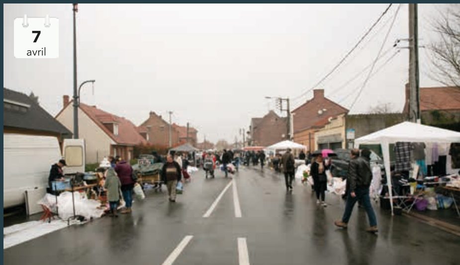
Braderie pluvieuse, braderie heureuse... pas sûr que les participants de la braderie de Flers-Centre aient apprécié cette citation.