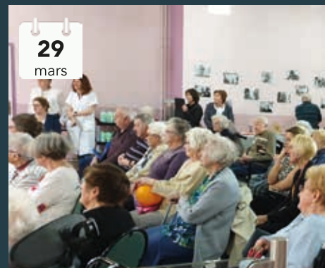
La compagnie de théâtre «Détourné» a organisé une semaine des ateliers (chant, danse, t