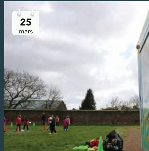
Une initiation au football était prévue à nariat avec la Fédération Française de F