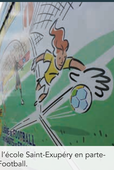
l'école Saint-Exupéry en parte-Football.