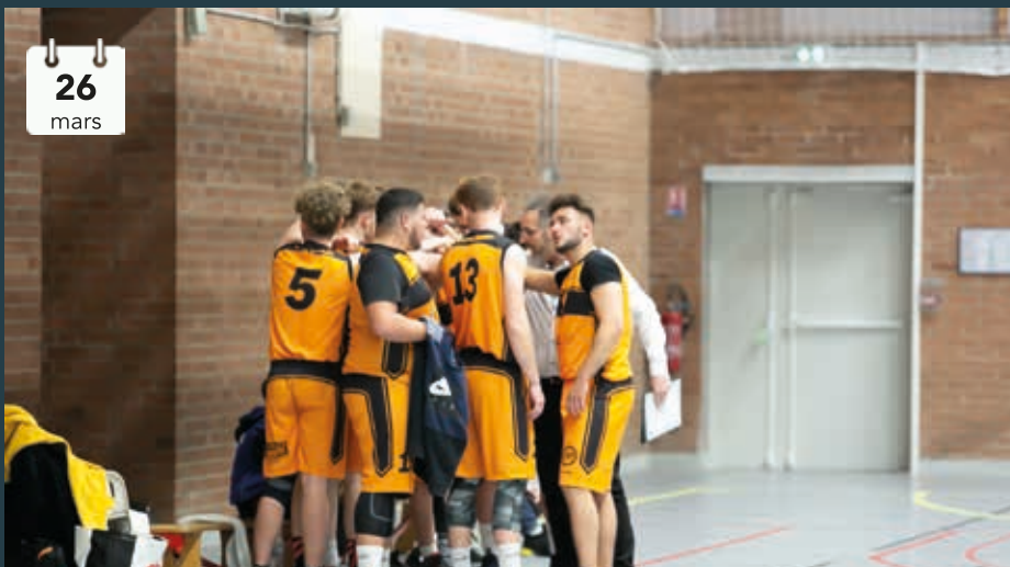
Les U20 de l'ABF se sont qualifiés pour la finale de la coupe du Douaisis en battant leurs voisins du club de l'AAE Douai-Dorignies. Ils affronteront Lambres en finale le 26 mai prochain à la salle Wandwingor.