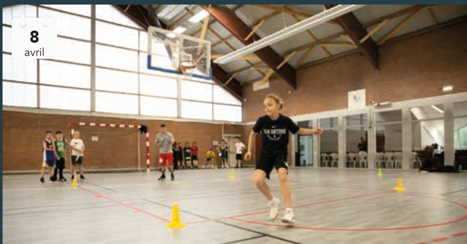
Du 8 au 12 avril, des jeunes basketteurs de l'Avenir Basket Flersois mais aussi de clubs extérieurs ont suivi des «clinics» avec des entraîneurs américains et serbes. Une bonne façon d'améliorer son jeu mais aussi de parfaire son anglais !