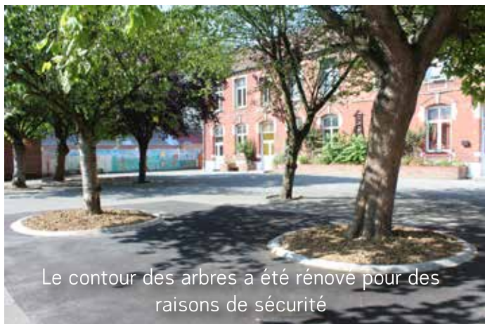
Le contour des arbres a été rénové pour des raisons de sécurité

Dans le bureau de la directrice, les cloisons ont été rénovées. Des cadenas ont été posés sur les portes des classes élémentaires.