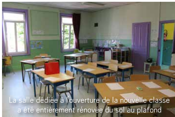
La salle dédiée à l'ouverture de la nouvelle classe a été entièrement rénovée du sol au plafond